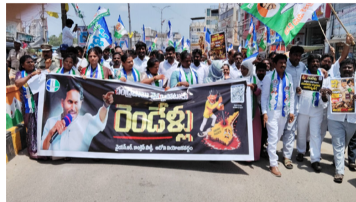
ఆదోని వీధిలో ప్రజా గర్జన ప్రభుత్వానికి