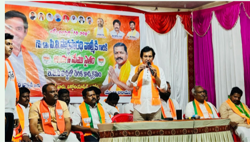
ఎం.ఆదినారాయణ నేతృత్వంలో బజిపిలో 200 కుటుంబాలు చేరిక

నాయక్, జిల్లా కార్యకర్త నభ్యలు, నంద్యాల నియోజకవర్గ కార్యకర్త నభ్యలు, మాజీ సర్పంచి, మాజీ ఎంపీటీసీలు, మాజీ కౌన్సిలర్ లు, వైసీపీ నాయకులు, కార్యకర్తలు, అభిమానులు పెద్ద ఎత్తున ర్యాలీలో పాల్గొన్నారు. కూటమి ప్రభుత్వ తీరుపై మాజీ ఎమ్మెల్యే శిల్పా రవిచంద్రకిషోర్ రెడ్డి తీవ్రస్థాయిలో దుజంమోతారు నిప్పులు చెరిగారు.అధికారంలోకి వస్తే ఆదర్శ నిధి కింద 1500 రూపాయలు, నిరుద్యోగ భృతి కింద 3000 రూపాయలు, తల్లికి వందన కింద 15 వేలు ఇస్తామని చెప్పి ఇప్పుడు లబ్ధిదారులను కుదిచి ప్రజలను వదిలివదిలి మండిపడ్డారు. గత వైసీపీ ప్రభుత్వంలో రైతులకు మద్దతు ధర ఇచ్చి పంటలు కొనుగోలు చేస్తే.. నేడు కూటమి ప్రభుత్వంలో రైతులకు యూరియా, సాగునీరు అందక రోడ్డు నిరసనలు చేయాలని పరిస్థితి వచ్చిందన్నారు. 'అన్నదాత సుఖిభవ' కింద 20 వేలు ఇస్తామని చెప్పి మోసం చేశారని దుజంమోతారు. రాష్ట్రంలో పెట్రోల్, డీజిల్ ధరలు పెంచి ప్రజల నడ్డి పరిచారు.. అభివృద్ధిని గాలికి వదిలి ప్రభుత్వ కార్యాలయాల్లో అవినీతికి తెరతీపారని విమర్శించారు. డీఎస్సీ స్టాఫ్ కోటా అవినీతిపై విచారణ జరపాలని డిమాండ్ చేశారు. డా. వైఎస్సార్ విగ్రహాన్ని మళ్లీ ప్రతిష్ఠాపాఠం శిల్పా రవిచంద్రకిషోర్ నంద్యాల శ్రీనివాస సెంటర్లో డా. వైఎస్సార్ విగ్రహాన్ని ధ్వంసం చేయడంపై శిల్పా రవిచంద్రకిషోర్ తీవ్ర ఆగ్రహం వ్యక్తం చేశారు. ఇటువంటి విధ్వంసాలు