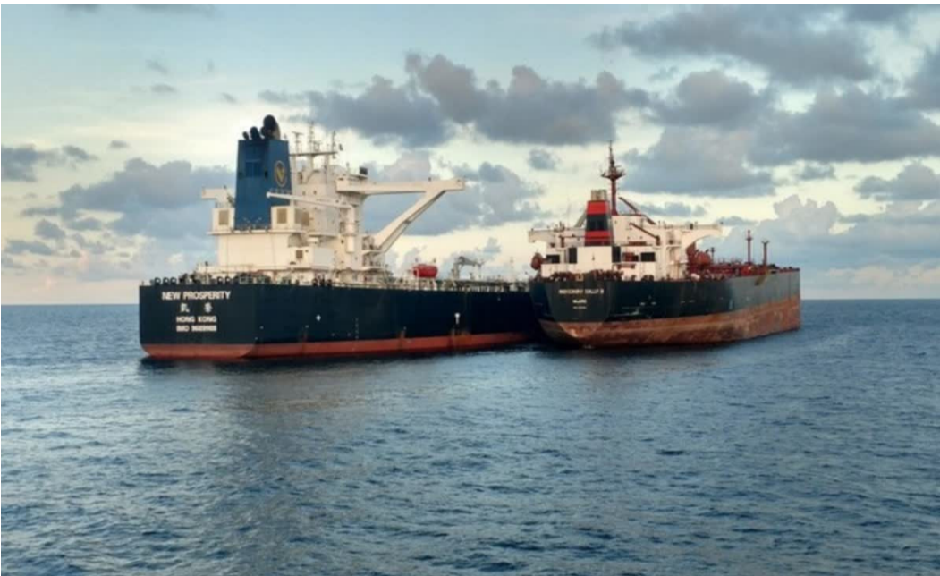
అమెరికా నుంచి మరీ ఇలా ఏంటి

మళ్లీ రష్యానే టాప్ అమెరికా నుంచి భారీగా తగ్గిన కొనుగోళ్లు రష్యా, యూపిఈ నుంచి చమురు దిగుమతుల్ని భారీగా పెంచిన భారత్ ఇప్పటికే అతిపెద్ద సరఫరాదారుగా రష్యానే- యూపిఈ నుంచి కూడా లికార్డు స్థాయిలో పెరిగిన చమురు కొనుగోళ్లు