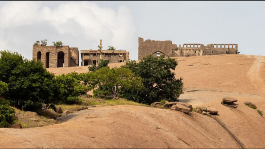
రోమ్ వేతో భువనగిరి కోటకు కొత్త ఆకర్షణ.. అక్టోబర్ నాటికి సిద్ధం

RNI.NO : APTEL/2022/90211 సంపుటి : 04 సంచిక : 67 పేజిలు : 08, వెల రూ. 1 రూ/ www.akshratimes.com మంగళవారం 23 - 06 - 2026