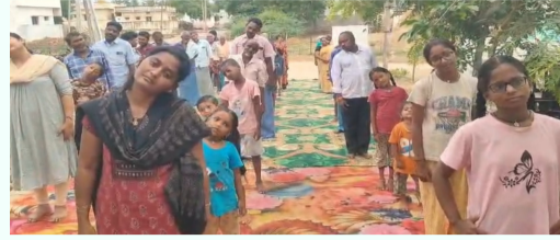
యోగాను నిత్య జీవితంలో భాగం చేసుకోవాలి: అంతర్జాతీయంగా గుర్తింపు పొందిన యోగా భారతదేశానికి చెందిన గౌరవ సంప్రదాయమని, ఆరోగ్యవంతమైన సమాజ నిర్మాణానికి యోగా ఎంతో దోహదపడుతుందని అధికారులు పేర్కొన్నారు. ప్రతి ఒక్కరూ యోగాను నిత్య జీవితంలో భాగంగా చేసుకుని ఆరోగ్యంగా జీవించాలని పిలుపునిచ్చారు.