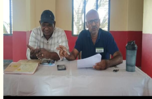
న్యాయశాఖ మంత్రి పదవికి ఏకంగా రాజీనామా చేసిన ధీశాలి అన్నారు. ప్రపంచ పార్లమెంటులో చరిత్రలో ఇది అరుదైన ఘట్టం అన్నారు. మహిళా విద్య, రాజకీయ, ఆర్థిక అవకాశాలు, సమాన పని, వేతనాలు, ప్రసూతి సెలవులు, గర్భిణీ స్త్రీలకు రక్షణ, ఆస్తి హక్కు, వారసత్వపు హక్కు, రక్షత హక్కు, సమాన గౌరవం కోసం చట్టాలు రూపొందించి పార్లమెంట్ లో వాటి ఆమోదం కోసం భారతీయ మహనీయుడు అంబేద్కర్ కు భారతదేశంలో మహిళలు బుజుబడి ఉంటారన్నారు. బోధించు-సమీకరించు-పోరాడు అన్న అంబేద్కర్ పిలుపు వింటే కేవలం దళితల కోసం మాత్రమే కాకుండా భారత