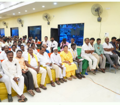
అత్యంత విలువైనది, ప్రతి అర్హులైన వారు ఓటరుగా నమోదు కావడం ఎంతో ముఖ్యమని ఈ సందర్భంగా పేర్కొన్నారు. ఈ సమావేశంలో కావలి నియోజకవర్గ పట్టణ,మండల పార్టీ అధ్యక్షులు, తెలుగుదేశం పార్టీ, బాక్ కన్వీనర్, బాక్ కో కన్వీనర్, యూనిట్, కో యూనిట్, క్లస్టర్, కో క్లస్టర్లు, ప్రధాన కార్యదర్శులు, వార్డు, గ్రామ పంచాయితీ ప్రెసిడెంట్, సెక్టర్ల మరియు ముఖ్య నాయకులు, తెలుగుదేశం పార్టీ నాయకులు భారీగా పాల్గొన్నారు.