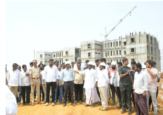
అద్భుతమైన పెట్టుబడి అని ఉప ముఖ్యమంత్రి భద్ర విక్రమార్కు స్పష్టం చేశారు. లక్ష్మీపురం సూట్ అవరణ అంతా తిరుగుతూ పనుల ప్రగతిని స్వయంగా అంచనా వేసిన డిప్యూటీ సీఎం. సైన్స్, మ్యాథ్స్, కంప్యూటర్, మెకానికల్ ల్యాబ్ భవనాల నిర్మాణ నాణ్యతపై అధికారులకు కీలక సూచనలు. గడువులోగా పనులు పూర్తి చేసి విద్యార్థులకు అందుబాటులోకి తీసుకురావాలని గుత్తదారులకు డిప్యూటీ సీఎం స్పష్టంగా చెప్పారు.