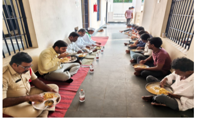
గద్దలూరు,జూన్ 07,అక్షర టైమ్స్ :- మార్కాపురం జిల్లా, గద్దలూరు సబ్ జైల్ ని ఆదివారం ప్రపంచ ఆహార భద్రత దినోత్సవం సందర్భంగా గద్దలూరు న్యాయమూర్తి భరత్ చంద్ర సందర్శించారు. జైలకు అందిస్తున్న సదుపాయాలను పరిశీలించారు. తరువాత ఆహార నాణ్యతను కూడా పరిశీలించారు. అంతేకాకుండా జైలలో కలిసి న్యాయమూర్తి ఆహార తిన్నారు. తిన్న తర్వాత ఆహార నాణ్యత పై సందర్శి వ్యక్తం చేశారు. తర్వాత జైలలో సమస్యలను అడిగి తెలుసుకుని న్యాయ సహాయం అందిస్తామని వారికి తెలిపారు. అలానే నేర ప్రవృత్తిని సత్వరంగా మెలగాలని జైలదారుల న్యాయమూర్తి భరత్ చంద్ర కోస్తాల్సిందిగా ఇచ్చారు. ఈ కార్యక్రమంలో జైల శాఖ అధికారులతో పాటు న్యాయవాదులు పాల్గొన్నారు.