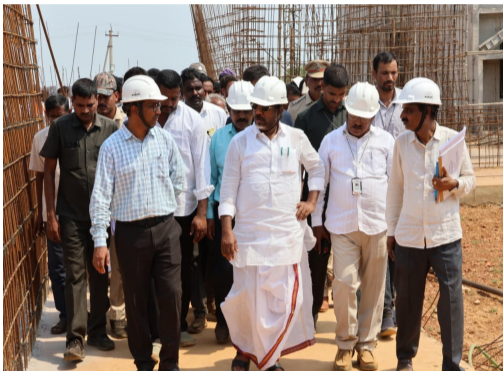
పనులను ప్రత్యేకంగా పరిశీలించారు. పనుల్లో ఎక్కడా నాణ్యత లోపంపకుండా, నిబంధనల ప్రకారం అత్యుత్తమ ప్రమాణాలు పాటించాలని స్పష్టం చేశారు. పనులను మరింత వేగవంతం చేసే నకాలలో పూర్తి చేయాలని అధికారులను, గుత్తదారులను (కాంట్రాక్టర్లను) ఆదేశించారు. అలాగే ఒక పెట్టుబడి విద్య కోసం ప్రభుత్వం ఖర్చు చేసే ప్రతి రూపాయి.. కేవలం వ్యయం కాదు, అది రాబోయే భవిష్యత్ తరాలను శక్తివంతంగా నిర్మించడం కోసం పెట్టే

భోనకల్, జూన్ 07, అక్షర టైమ్స్ - రాష్ట్రంలో నిర్మిస్తున్న ఇంటిగ్రేటెడ్ రెసిడెన్షియల్ సూట్ల కేవలం భవనాలు కావని, అవి రేపటి తరచిన కుటుంబాలకు తీర్చిదిద్దే “దార్శనిక దేవాలయాలు” అని రాష్ట్ర ఉప ముఖ్యమంత్రి భద్ర విక్రమార్కు అభివర్ణించారు. విద్యకు ఇందిరమ్మ ప్రజా ప్రభుత్వం అత్యధిక ప్రాధాన్యతనిస్తోందని ఆయన స్పష్టం చేశారు. ఆదివారం ఖమ్మం జిల్లా మధిర నియోజకవర్గ పరిధిలోని భోనకల్ లో మండలం లక్ష్మీపురంలోని ఇంటిగ్రేటెడ్ రెసిడెన్షియల్ సూట్ నిర్మాణ పనులను డిప్యూటీ సీఎం క్షేత్రస్థాయిలో పరిశీలించారు. నాణ్యతతో.. వేగంగా పూర్తి చేయాలిని దేశంలో ఉన్న ఇంటిగ్రేటెడ్ పాఠశాలలోని భవన సముదాయాలను డిప్యూటీ సీఎం భద్ర విక్రమార్కు కాలనీలకు తిరుగుతూ క్షుణ్ణంగా పరిశీలించారు. జూనియర్ హాస్టల్, జూనియర్ సీనియర్ విభాగాలు, ఆడిసిస్టెంట్ ట్యాక్ నిర్మాణ ప్రగతిని అధికారులను అడిగి తెలుసుకున్నారు. విద్యార్థుల ఉజ్జల భవిష్యత్తుకు వేదికలుగా నిలిచే మెకానికల్, సైన్స్, మ్యాథమెటిక్స్, కంప్యూటర్ ల్యాబ్ భవనాల