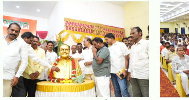
నాయకులకు సూచించారు. ప్రతి బాక్ పరిధిలో ఓటర్ల వివరాలను క్లుప్తంగా పరిశీలించి అర్హులైన ప్రతి ఒక్కరికి ఓటు హక్కు కల్పించేందుకు కృషి చేయాలని పిలుపునిచ్చారు. అలాగే ఓటర్ల జాబితా సవరణ ప్రక్రియలో పాల్గొనాలని, కార్యకర్తలు సమన్వయంతో పనిచేసి ప్రజలకు అవగాహన కల్పించాలని, ఎన్నికల సంఘం మార్గదర్శకాలకు అనుగుణంగా కార్యక్రమాలను నిర్వహించాలని సూచించారు. ప్రజాస్వామ్య వ్యవస్థలో ఓటు హక్కు