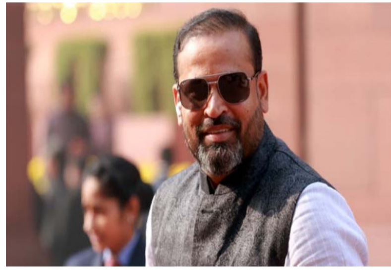
వార్తలు కేవలం కల్పితమని గంగూలీ స్పష్టం చేశారు. 2024 లోక్సభ ఎన్నికల్లో పశ్చిమ బెంగాల్లోని బెన్ద్రంపూర్ స్థానం నుంచి టీఎంసీ తరఫున పోటీ చేసిన యూసుఫ్ పఠాన్ విజయం సాధించారు. కాంగ్రెస్ కంచుకోటగా ఉన్న ఈ స్థానంలో సీనియర్ నేత అధిర రంజన్ చౌదరిని అయిన ఓడించారు. ఈ నేపథ్యంలో మమతా బెనర్జీ కోసం పఠాన్ తన సీటును త్యాగం చేయాలి వస్తుందని గత కొద్ది రోజులుగా జరుగుతున్న ప్రచారానికి ఆయన తాజా ప్రకటనతో తెరవడింది.

త్వజమాన్ కాంగ్రెస్ (టీఎంసీ) అధినేత్ర మమతా బెనర్జీ కోసం తన ఎంపీ పదవికి రాజీనామా చేయాలని అభిప్రాయం కోరినట్లు వస్తున్న వార్తలపై మాజీ క్రికెటర్, టీఎంసీ ఎంపీ యూసుఫ్ పఠాన్ స్పష్టతనిచ్చారు. ఆ వార్తల్లో ఏమాత్రం వాస్తవం లేదని ఆయన కొద్దిపాటికాశారు. ఈ మేరకు నిన్న సోషల్ మీడియా వేదికగా ఒక వీడియో నందేశాన్ని విడుదల చేశారు. “గత కొంతకాలంగా సోషల్ మీడియాలో ఒక వార్త వైరల్ అవుతోంది. బెన్ద్రంపూర్ లోక్సభ స్థానానికి నేను రాజీనామా చేయాలని, తర్వాత మమతా బెనర్జీ అక్కడ నుంచి పోటీ చేస్తారని ప్రచారం జరుగుతోంది. ఈ విషయంపై మమతా బెనర్జీ నాతో ఎప్పుడూ చర్చించలేదు. పార్టీలోని ఏ ఒక్క నాయకుడు కూడా నన్ను రాజీనామా చేయమని అడగలేదు. ఈ ప్రచారం పూర్తిగా అవాస్తవం” అని యూసుఫ్ పఠాన్ తన వీడియోలో పేర్కొన్నారు. మమతా బెనర్జీకి, యూసుఫ్ పఠాన్ మధ్య భారత మాజీ కెప్టెన్ సారంగ్ గంగూలీ మధ్యవర్తిత్వం వహించారన్న ఆరోపణలను గంగూలీ సైతం తీవ్రంగా ఖండించారు. ఈ మేరకు ఆయన ఒక అధికారిక ప్రకటన విడుదల చేశారు. మమతా బెనర్జీ తనను ఈ విషయంలో ఎప్పుడూ సంప్రదించలేదని, తాను పఠాన్తో మాట్లాడలేదని, ఈ