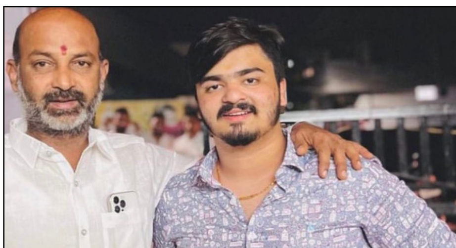
పోక్సో కేసు బండి భగీరథ్ కు సీట్ నోటీసులు నేడు మధ్యాహ్నం విచారణకు హాజరు కావాలని నోటీసులు