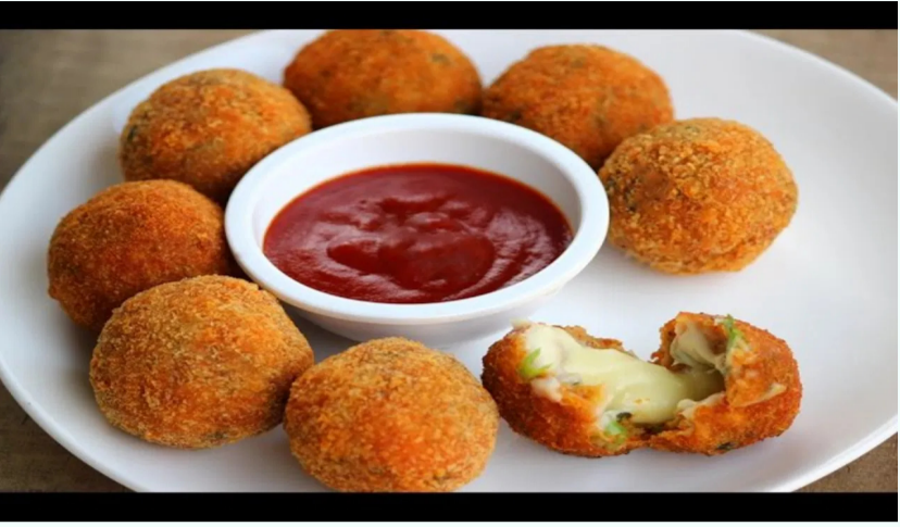
సులభమవుతుంది. రుచికరమైన పదార్థాలను జోడించడం

అన్నంలో రుచిని పెంచడానికి, సన్నగా తరిగిన ఉల్లివాయలు, క్యారెట్, టీన్స్ లేదా ఇతర క' న' గా యం ల ను జోడించాలి. ఈ కూరగాయలు మిశ్రమానికి క్రంపీ టెక్చర్ను అందిస్తాయి. ఆలాగే, కొద్దిగా ఉప్పు, మిరియాల