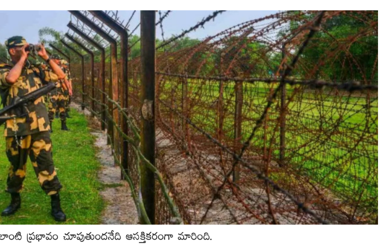
ఎలాంటి ప్రణాళికలు చేపట్టకుండానే అసంతోషంగా మారింది.

మొదటివేళ తరువాయి - పశ్చిమ బెంగాల్ లో సువేందు అధికారి నేతృత్వంలోని సూతన ప్రభుత్వం ఆధికారంలోకి వచ్చిన వెంటనే సరిహద్దు రక్షణపై తీసుకున్న నిర్ణయం ఇప్పుడు అంతర్జాతీయ స్థాయిలో చర్చించబడుతోంది. ముఖ్యంగా భారత్-బెంగాల్ సరిహద్దుల్లో కంచె నిర్మాణం కోసం అనుమతి కోసం భూమిని కేటాయిస్తూ తీసుకున్న నిర్ణయంపై బెంగాల్ ప్రభుత్వం తాజాగా స్పందించింది. భారత్ సరిహద్దుల్లో ముళ్లకంచె వేయడంపై బెంగాల్ విదేశాంగ శాఖ సలహాదారు ఎం. హెచ్. కబీర్ అసంతోషం వ్యక్తం చేశారు. "ముళ్లకీలకు ధాతా భయపడదు" అని పేర్కొంటూనే, తమ జాతీయ ప్రయోజనాలను కాపాడుకునేందుకు అన్ని చర్యలు తీసుకుంటామని స్పష్టం చేశారు. భారత్ అంతర్గత రాజకీయాల్లో తాము జోక్యం చేసుకోమని, తమకు ప్రధానంగా కేంద్ర ప్రభుత్వంతోనే సంబంధాలు ఉంటాయని ఆయన వివరించారు. సవాళ్లు ఉన్నప్పటికీ ఇరు దేశాల మధ్య దైవాక్షిక్ సంబంధాలను మెరుగుపరిచేందుకు నాయకత్వం కట్టబడి ఉందని ఆయన అభిప్రాయం వ్యక్తం చేశారు. ఓజీవీ తన ఎన్నికల ప్రచారంలో ఇచ్చిన వాగ్దానం ప్రకారం, అధికారంలోకి వచ్చిన 45 రోజుల్లోనే సరిహద్దు కంచె నిర్మాణ ప్రక్రియను పూర్తి చేస్తామని ప్రకటించింది. ముఖ్యమంత్రి సువేందు అధికారి తొలి మంత్రివర్గ సమావేశంలోనే డీఎన్ఎఫ్ కు అవసరమైన భూమిని కేటాయించడం ద్వారా ఈ దిశగా బలమైన ముందుడుగు వేశారు. అక్రమ చొరబాట్లను అరికట్టడమే లక్ష్యంగా చేపట్టిన ఈ చర్య ఇప్పుడు పొరుగు దేశంతో ఉన్న సంబంధాలపై