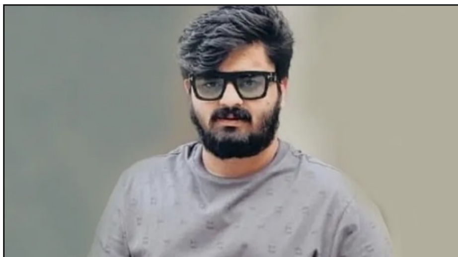
ముగిసిన బండి భగీరథ పోలీసు కస్టడీ.. జైలుకు తరలింపు