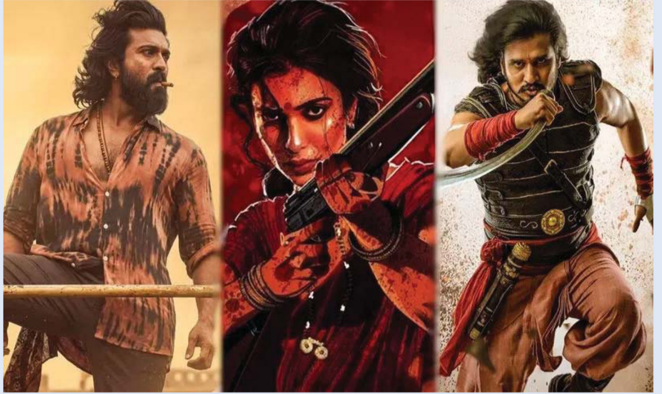
సిద్ధమవుతున్నాయి. ఇక వీటిలో ఏ సినీమా బాక్సాఫీస్ వద్ద సంచలనం సృష్టిస్తుందో చూడాలి.

ఒకేసారి నాలుగు సినిమాలు థియేటర్ లోకి రాబోతున్నాయి. 'బాలన్ ది బాయ్', 'ట్రాన్స్ ఫర్ త్రిమూర్తులు', హాటర్ కామెడీ మూవీ 'చెట్టు మీద దెయ్యం నాకేం భయం', అలాగే ఫ్యామిలీ ఎమోషన్స్ తో తెరకెక్కిన 'మా ఇంటి బంగారం' సినీమాలు ఒకేరోజు విడుదల కానున్నాయి. ఈ నాలుగు చిత్రాలు పూర్తిగా భిన్నమైన జోనర్ లో ఉండటంతో ప్రేక్షకులకు మంచి ఎంటర్ టైన్ మెంట్ ప్యాకేజీ లభించే అవకాశం ఉంది. ముఖ్యంగా హాటర్ కామెడీ సినీమాలకు ఇటీవల మంచి ఆదరణ లభిస్తున్న నేపథ్యంలో 'చెట్టు మీద దెయ్యం నాకేం భయం'పై ప్రత్యేక ఆసక్తి కనిపిస్తోంది. జూన్ చివరి వారం మాత్రం బాక్సాఫీస్ వద్ద భారీ హంగామా ఉండనుంది. జూన్ 26న పీరియాడిక్ యాక్షన్ డ్రామా 'స్వయంభూ' విడుదల కానుంది. ఈ సినిమాపై ఇప్పటికే సినీ వర్గాల్లో మంచి బజ్ నెలకొంది. అదే రోజున స్పోర్ట్స్ డ్రామా 'సూపర్ గోల్' కూడా ప్రేక్షకుల ముందుకు రానుంది. ఇక రాజకీయ నేపథ్యంలో తెరకెక్కిన ఇంటెన్స్ డ్రామా 'లెనిన్' కూడా జూన్ 26నే విడుదల కానుండటం విశేషం. దీంతో నెలాఖరులో మూడు ప్రధాన చిత్రాలు ఒకేసారి బాక్సాఫీస్ బరిలోకి దిగనున్నాయి. మొత్తం మీద చూస్తే 2026 జూన్ నెల టాలీవుడ్ ప్రేక్షకులకు పుల్ ఎంటర్ టైన్ మెంట్ ఇవ్వబోతోందనే చెప్పాలి. భారీ పాన్ ఇండియా సినీమాల నుంచి చిన్న కాన్సెప్ట్ మూవీస్ వరకు అన్ని రకాల చిత్రాలు ప్రేక్షకులను అలరించేందుకు