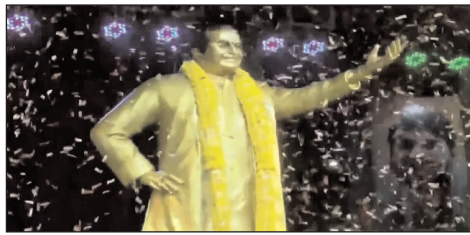
ఎన్టీఆర్ విగ్రహాన్ని ఆవిష్కరించిన రేవంత్ రెడ్డి భారీగా వచ్చిన అభిమానులు