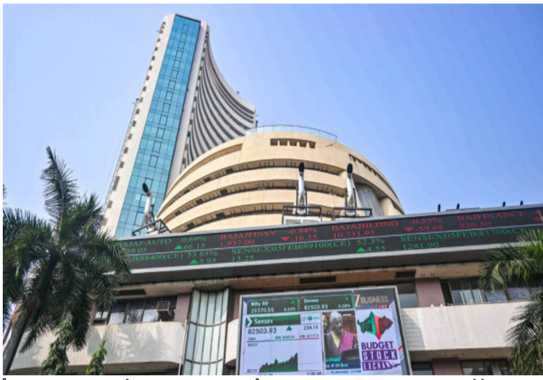
క్షీణత వంటి కారణాలతో ఈ ఏడాది సెన్సెక్స్, నిఫ్టీలు 8 శాతం వరకు నష్టపోయాయి. విదేశీ సంస్థాగ్రహణ పెట్టుబడిదారులు నిధులను ఉపసంహరించుకోవడం కూడా ఒత్తిడి పెంచుతోంది. అయినప్పటికీ, దేశీయ రిటైల్ ఇన్వెస్టర్లు, మ్యూచువల్ ఫండ్ ఎన్ఐఐఎల్ రూపంలో వస్తున్న పెట్టుబడులు భారత మార్కెట్ కు అండగా నిలుస్తున్నాయని ఆర్థిక నిపుణులు విశ్లేషిస్తున్నారు.

ప్రపంచ స్టాక్ మార్కెట్లో భారత్ కు అసూహ్యంగా ఎదురుదెబ్బ తగిలింది. మార్కెట్ విలువ పరంగా భారత్ ను అధిగమించిన దిన్న దేశం త్రైవాన్ ప్రపంచంలో ఐదో అతిపెద్ద స్టాక్ మార్కెట్గా అవతరించింది. బుధవారం ట్రేడింగ్ త్రైవాన్ మార్కెట్ విలువ 5 ట్రిలియన్ డాలర్లకు చేరుకుని కాగా, భారత మార్కెట్ క్యాపిటలైజేషన్ 4.92 ట్రిలియన్ డాలర్లకు పరిమితమైంది. దీంతో భారత్ అలో స్థానానికి పడిపోయింది. ప్రస్తుతం ఈ జాబితాలో అమెరికా (77.95 ట్రిలియన్ డాలర్లు) అగ్రస్థానంలో ఉండగా, చైనా, జపాన్, హాంకాంగ్ తర్వాతి స్థానాల్లో ఉన్నాయి. త్రైవాన్ ఈ ఘనత సాధించడం వెనుక కృత్రిమ మేధ, సెమీకండక్టర్ల (ఐఐ) బామ్ కీలక పాత్ర పోషించింది. ప్రపంచంలోనే అతిపెద్ద కాంట్రాక్ట్ ఐఐ తయారీ సంస్థ అయిన త్రైవాన్ సెమీకండక్టర్ల మాన్యుఫ్యాక్చరింగ్ కంపెనీ (హావీజి) షేర్లు గత ఏడాదిలో 130 శాతం మేర పెరిగాయి. ఎన్నికల, యూపీఆర్ వంటి టెక్ డిగ్జెస్టలు ఐఐ వివేలను సరఫరా చేస్తుండటంతో గ్లోబల్ ఇన్వెస్టర్లు త్రైవాన్ మార్కెట్పై భారీగా పెట్టుబడులు పెట్టారు. ఇదే సమయంలో భారత మార్కెట్లు పలు ప్రతికూలతలను ఎదుర్కొంటున్నాయి. పశ్చిమాసియా ఉద్రిక్తతలు, ఇండోనేషియా ధరల పెరుగుదల, రూపాయి