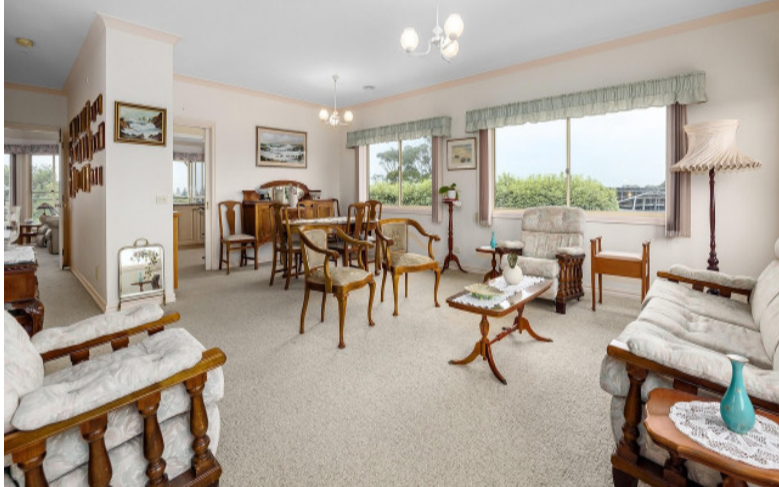
టైల్స్ లేదా కాంట్రీల్ పైన కూడా వేయవచ్చు. ఇది ఇంటిని విశాలంగా, శుభ్రంగా కనిపించేలా చేస్తుంది. 4. మార్బుల్ ఇన్లెట్: ఆధునిక వాల్టెజిల్ కటింగ్ టెక్నిక్ తో మార్బుల్ పై మెయిఫర్ కాలం నాటి డిజైన్ల వంటి క్లిష్టమైన నమూనాలను చెక్కడం ఇప్పుడు సులభతరమైంది. విల్లాలు, ప్రవేశ ద్వారాలు, పూజ గదుల్లో ఈ ఇన్లెట్ ఫ్లోరింగ్ ఇంటికి సంప్రదాయబద్ధమైన, విలాసవంతమైన లుక్ ను ఇస్తుంది. మొత్తం మీద, ఫ్లోరింగ్ ను ఇప్పుడు ఇంటి విలువను పెంచే ప్రధాన అకర్షణగా పరిగణిస్తున్నారు. సాధారణ యూనిఫాం టైల్స్ కు బదులుగా, ప్రత్యేకమైన డిజైన్లతో కూడిన ఫ్లోరింగ్ ఇంటికి ప్రత్యేక గుర్తింపు తీసుకురావడం ప్రస్తుత ట్రెండ్.