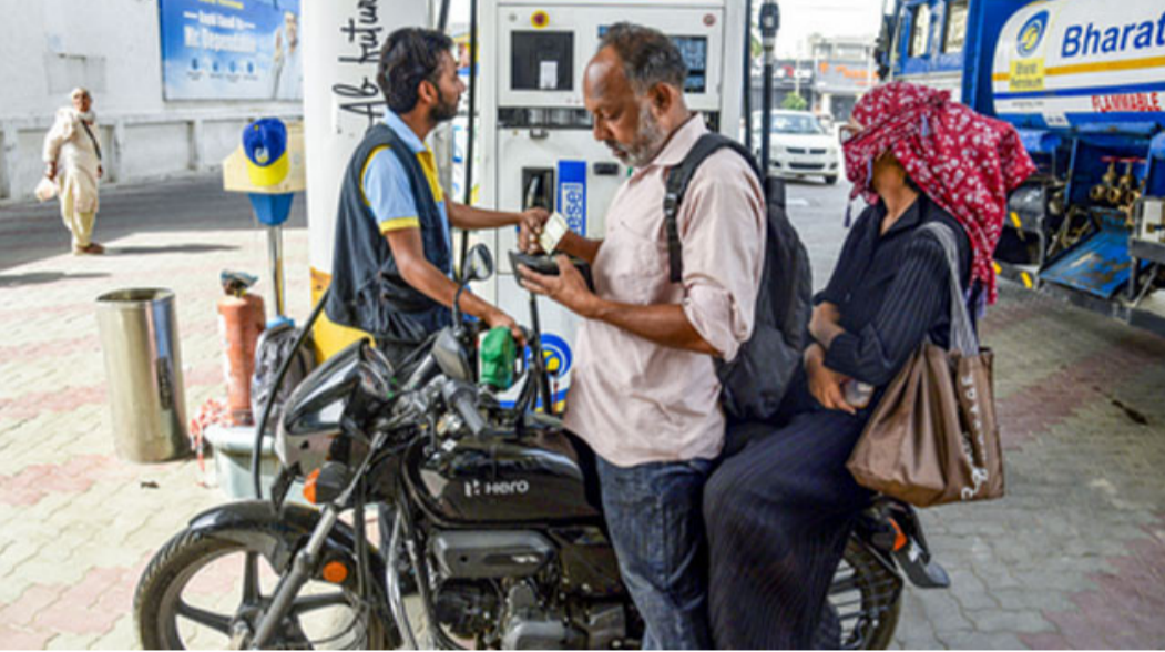
చేసింది. ఈ పరిస్థితిని తీవ్రంగా పరిగణించిన కేంద్రం, అత్యధిక నిల్వలు, భాగీ మార్కెటింగ్ కు పాల్పడే వారిపై కఠిన చర్యలు తీసుకోవాలని రాష్ట్రాలను ఆదేశించింది. 'అత్యవసర వస్తువుల చట్టం' కింద చర్యలు చేపట్టాలని, ప్రత్యేక నిధులు బృందాలను ఏర్పాటు చేయాలని సూచించింది. సామాన్యజీవీ కోసం ఉద్దేశించిన ఇంధనాన్ని పారిశ్రామిక అవసరాలకు మళ్లించవద్దని పరిశ్రమల సంఘాలకు కూడా హెచ్చరికలు జారీ చేసింది. దేశంలో పెట్రోల్, డీజిల్ నిల్వలకు ఎలాంటి కొరత లేదని కేంద్ర పెట్రోలియం మంత్రిత్వ శాఖ భరోసా ఇచ్చింది. దేశీయ అవసరాలు తీరగా, భారత్ పెట్రోలియం ఉత్పత్తులను పెద్ద ఎత్తున ఎగుమతి కూడా చేస్తోంది గుర్తు చేసింది. దేశంలో సస్య సమస్య లేదని, ధరల వ్యత్యాసం వల్ల కొరత ఏర్పడుతోందన్న పుకార్లను ప్రజలు నమ్మవద్దని విజ్ఞప్తి చేసింది.

అంతర్జాతీయంగా ముడి చమురు ధరలు పెరుగుతున్నప్పటికీ, దేశీయంగా సామాన్యజీవీ భారం పడకుండా కేంద్ర ప్రభుత్వం కీలక చర్యలు చేపట్టింది. ప్రభుత్వ రంగ చమురు సంస్థలు (పీఎస్ఐఎల్) పెట్రోల్, డీజిల్, ఎల్పీజీ అమ్మకాలపై రోజుకు సుమారు రూ.550 కోట్ల నష్టాన్ని భరిస్తున్నాయని కేంద్ర పెట్రోలియం మంత్రిత్వ శాఖ బుధవారం వెల్లడించింది. పశ్చిమాసియాలో నెలకొన్న సంక్షోభం కారణంగా అంతర్జాతీయంగా ధరలు పెరిగాయి. అయినప్పటికీ, ఆ పెరిగిన ధరలను దేశీయ రిటైల్ మార్కెట్ కు బదిలీ చేయకుండా వినియోగదారులకు ఉపశమనం కల్పిస్తున్నారు. ఈ ప్రయత్నం కేవలం సాధారణ గృహాలు, ద్వినీక వాహనదారులు, రైతుల వంటి రిటైల్ వినియోగదారులకు మాత్రమేనని, పారిశ్రామిక కొనుగోళ్లకు వర్తించని ప్రభుత్వం స్పష్టం చేసింది. అయితే, ఈ ధరల వ్యత్యాసం వల్ల కొత్త సమస్య తలెత్తింది. పారిశ్రామిక అవసరాల కోసం పెద్ద మొత్తంలో ఇంధనం కొనుగోలు చేసేవారు కూడా తక్కువ ధరకు లభించే రిటైల్ బంకులకు వస్తున్నారు. దీనివల్ల ప్రైవేట్ సంస్థల డీజిల్ అమ్మకాలు 38 శాతం పడిపోగా, ఆ భారం ప్రభుత్వ రంగ బంకులపై పడుతోంది. కొన్ని ప్రాంతాల్లో ఇది స్థానిక కొరతకు దారితీసి ప్రమాదం ఉందని మంత్రిత్వ శాఖ అందోళన వ్యక్తం