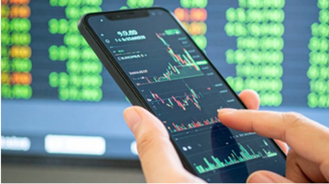
ఉందని, దీనిని దాటితే బుల్లి తిరిగి పట్టు సాధించగలరని షేర్హోల్డర్లు. నిఫ్టీలో ఒఎన్ఐసీ, హెచ్ఐఎఫ్ బ్యాంక్, హెచ్ఐఎఫ్ లైఫ్ ఇన్సూరెన్స్ షేర్లు ప్రధాన నష్టాల్లో ఉన్నాయి. మరోవైపు, వవర్గ్ కార్పొరేషన్, ఎలెక్ట్రో, ఎన్టీసీ షేర్లు 2 శాతానికి పైగా లాభపడగా.. టాటా స్టీల్, ఇండిగో, మారుతీ సుజుకి, టైటాన్ కంపెనీ, విపియన్ పెయింట్స్ కూడా లాభాలతో ముగిశాయి. సూచీలు బలహీనంగా ఉన్నప్పటికీ, మిడ్ క్యాప్, స్మాల్ క్యాప్ స్టాక్స్ రాణించడం విశేషం. రంగాలవారీగా చూస్తే ఫైనాన్షియల్ సర్వీసెస్, బ్యాంకింగ్ సూచీలు నష్టపోగా, మీడియా, మెటల్, ఆటో సూచీలు లాభపడ్డాయి.

బుధవారం నాటి ట్రేడింగ్లో దేశీయ స్టాక్ మార్కెట్లు ఒడుదొడుకుల మధ్య స్వల్ప నష్టాలతో ముగిశాయి. ప్రధానంగా బ్యాంకింగ్, ఫైనాన్షియల్ షేర్లలో అమ్మకాల ఒత్తిడి, అమెరికా-ఇరాన్ మధ్య నెలకొన్న భౌగోళిక రాజకీయ ఉద్రిక్తతలు ఇన్వెస్టర్లను ఆపివేసి అడుగులు వేసేలా చేశాయి. ట్రేడింగ్ ముగిసే సమయానికి, 30 షేర్ల సెన్సెక్స్ 141.90 పాయింట్లు నష్టపోయి 75,867.80 వద్ద స్థిరపడింది. ఇక, నిఫ్టీ కూడా 6.55 పాయింట్లు స్వల్ప నష్టంతో 23,907.15 వద్ద ముగిసింది. అమెరికా, ఇరాన్ మధ్య సమాధ్యకు చర్యలు జరుగుతున్నప్పటికీ, మంగళవారం రక్షణ ఇరాన్ పై అమెరికా దారులు చేసిన దాడుల వార్తలు అంతర్జాతీయంగా అందోళనలను పెంచాయి. ఈ పరిణామాలు మార్కెట్ సెంటిమెంట్ ను దెబ్బతీశాయి. దీనికి తోడు విదేశీ సంస్థాగ్రహణ పెట్టుబడిదారులు అమ్మకాల వైపు మొగ్గు చూపడం కూడా ప్రతికూల ప్రభావం చూపింది. టెక్నికల్ పరంగా చూస్తే, నిఫ్టీకి 23,800 పాయింట్ల వద్ద కీలక మద్దతు ఉంది. ఒకవేళ ఈ స్థాయిని కోల్పోతే 23,600-23,500 స్థాయిల వరకు పతనం ఉండొచ్చని విశ్లేషకులు చెబుతున్నారు. అదే సమయంలో, 24,000-24,100 శ్రేణి బలమైన విరోధంగా