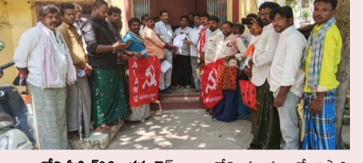
అదో, ఏప్రిల్ 06, అక్షర టైమ్స్:- అదోని మండలంలో ఉపాధి పనులు కల్పించాలని, ముఖ్య హాజరు రద్దు చేయాలని, అద్దలైన వృద్ధులు, వితంతువులు, వికలాంగులకు, పెన్షన్లు మంజూరు చేయాలని, అద్దల కలిగిన వాళ్ళందరికీ ఇబ్బలు మంజూరు చేసి పెండ్లిలో ఉన్న వారికి ఇంటి బిల్లులు ఇవ్వాలని కోరుతూ ఆంధ్ర ప్రదేశ్ వ్యవసాయ కార్మిక, గ్రామీణ కార్మిక సంఘం అధ్యక్షులు ఎంపీ డి.వో. కార్యాయం ముందు ధర్మా నిర్వహించడమైనది. అనంతరం ఈ సందర్భంగా వ్యవసాయ కార్మిక