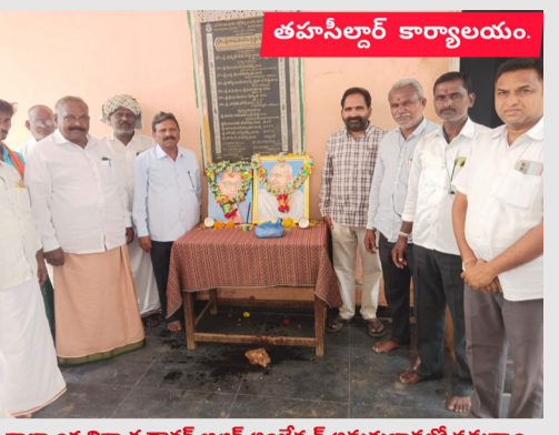
తహశీల్దార్ కార్యాలయం. - రాజ్యాంగ నిర్మాత డాక్టర్ బి ఆర్ అంబేద్కర్ అలంకారంలో ఘనంగా డాక్టర్ బి.ఆర్ అంబేద్కర్ 135వ జయంతి వేడుకలు - ప్రముఖ కార్యకర్తలతో అంబేద్కర్ చిత్రపటానికి ఘన నివాళులు - అంబేద్కర్ ఆచార సాధనకు ప్రతి ఒక్కరూ కృషి చేయాలని విలుపు