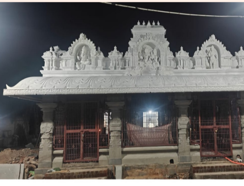
పామిడి, ఏప్రిల్ 22, అక్షర టైమ్స్: మండల కేంద్రమైన పామిడి పట్టణంలో ఎంతో చరిత్ర కలిగిన బౌద్ధరాజుల కాలంలో వెలసిన ప్రస్తుత పార్వతి భోగేశ్వరస్వామి ఆలయమును నిర్మించబడినది. ఆ పురాతన దేవాలయం రాష్ట్ర ప్రభుత్వం దేవాలయ ధర్మాలయ శాఖ ఆధ్వర్యంలో జీర్ణోద్ధరణ గావింపబడి పునర్నిర్మాణం గావింపబడినది. ఎంతో విశిష్టత చరిత్ర కలిగిన ఈ క్షేత్రంలో శ్రీ