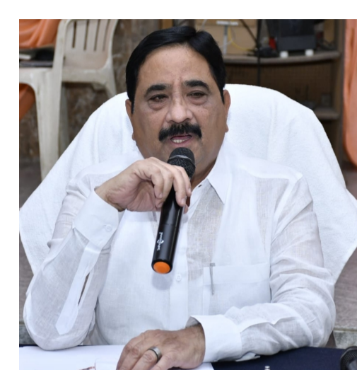
రాష్ట్రంలోనూ లేవని, పేదరికం లేని సమాజం ఉండాలనే ఉద్దేశంతో ముఖ్యమంత్రి చంద్రబాబు నాయుడు సంక్షేమానికి పెద్దపీట వేస్తున్నారని వివరించారు. అయితే, కేవలం సంక్షేమానికే పరిమితం కాకుండా అభివృద్ధిలోనూ సమతుల్యత పాటించిస్తున్నాడే సమగ్ర

రాయదుర్గం, ఏప్రిల్ 22, అక్షర టైమ్స్: ప్రజల జీవన ప్రమాణాల్లో విప్లవాత్మక మార్పులు వచ్చేలా అధికారులు, ప్రజాప్రతినిధులు వరసగా సహకారంతో ముందుకు సాగాలని, అందుకోసం ప్రతి అధికారి ఒక విజయాల (దూరదృష్టితో) పనిచేయాలని రాయదుర్గం ఎమ్మెల్యే కాలవ శ్రీనివాసులు పిలుపునిచ్చారు. బుధవారం రాయదుర్గం పట్టణంలోని ఎంపీటీవీ కార్యాలయంలో నిర్వహించిన సమీక్షా సమావేశంలో ఆయన "స్వచ్ఛ రాయదుర్గం విజన్ 2047" యాక్షన్ ప్లాన్ గురించి అధికారులతో చర్చించారు. ? ఈ సందర్భంగా ఆయన మాట్లాడుతూ.. మనం కేవలం వర్తమానం గురించి కాకుండా, రాబోయే పాతికేళ్ల కాలంలో ప్రజల జీవన ప్రమాణాలు ఏ విధంగా ఉండాలి అలోచించాలని సూచించారు. ప్రజల ఆశలకు అనుగుణంగా ఏ ఏ ఏ రంగాల్లో ఎలాంటి పురోగతి సాధించాలి. స్వచ్ఛమైన అవగాహన ఉన్నప్పుడే లక్ష్యాలు చేరుకోగలమన్నారు. భవిష్యత్తు అవసరాలపై సమగ్ర ప్రణాళికను రూపొందించుకుని, వాటి సాధనకు సిద్ధం కావాలని అధికారులను ఆదేశించారు. ఆంధ్రప్రదేశ్ అభివృద్ధి చెందిన రాష్ట్రం గుర్తింపు పొందాలంటే ఇలాంటి పక్కా ప్రణాళికలు అవసరమని ఆయన అభిప్రాయపడ్డారు. ప్రస్తుతం తెలుగు రాష్ట్రాల్లో అమలువుతున్న సంక్షేమ పథకాలు మరే ఇతర