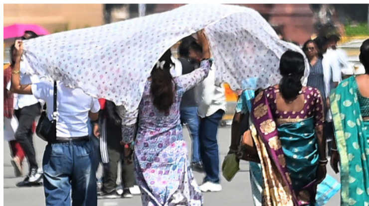
అమరావతి : ఆంధ్రప్రదేశ్ను తీవ్రమైన ఎండలు, వడగాల్పులు ఉక్కిరిబిక్కిరి చేస్తున్నాయి. రాష్ట్రంలోని అనేక ప్రాంతాల్లో ఉష్ణోగ్రతలు రికార్డు స్థాయికి చేరుకుంటున్నాయి. గురువారం ఒక్కరోజే నంద్యాల జిల్లా సంజామలలో అత్యధికంగా 45.1 డిగ్రీల సెల్సియస్ ఉష్ణోగ్రత నమోదైంది. రాజ్ యే మే, జూన్ నెలల్లో ఎండలు మరింత తీవ్రంగా ఉంటాయని, - మిగతా 2 లో