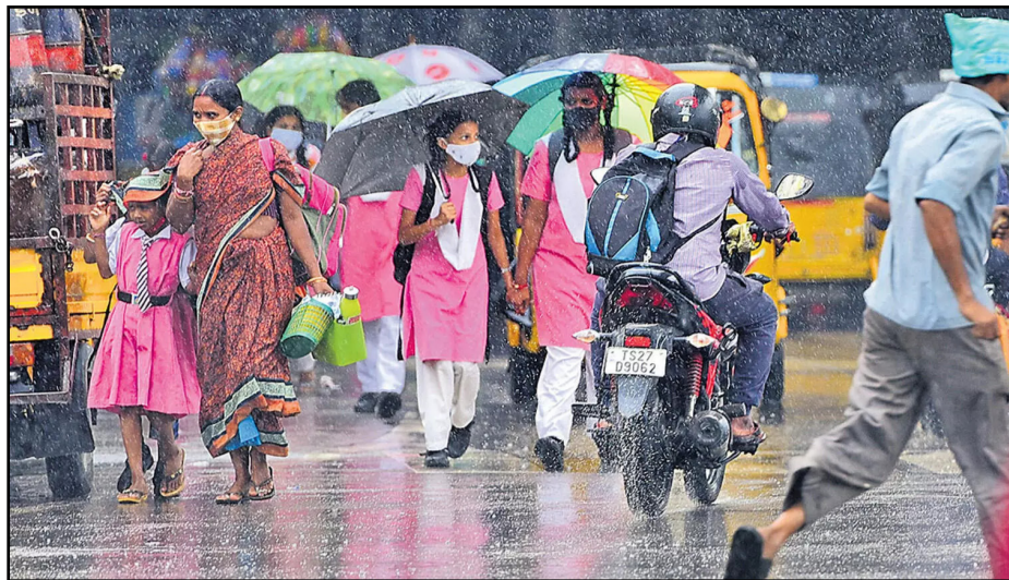
తెలంగాణలో ఐదు రోజుల పాటు వర్షాలు హైదరాబాద్ వాతావరణ కేంద్రం