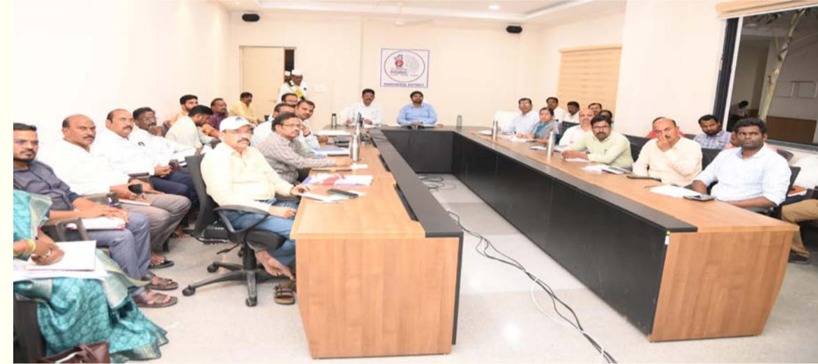
- రాష్ట్ర ఉప ముఖ్యమంత్రి, ఆర్థిక, ప్రణాళిక శాఖ మంత్రి మల్లు భట్టి విక్రమార్కు

మంచిర్యాల,మార్చి31.అక్షర టైమ్స్:- ప్రజాపాలన - ప్రగతి ప్రణాళిక 99 రోజుల కార్యచరణలో భాగంగా గ్రామసభలు/వార్డు సభలు పకడ్బందీగా నిర్వహించాలని రాష్ట్ర ఉప ముఖ్యమంత్రి, ఆర్థిక,