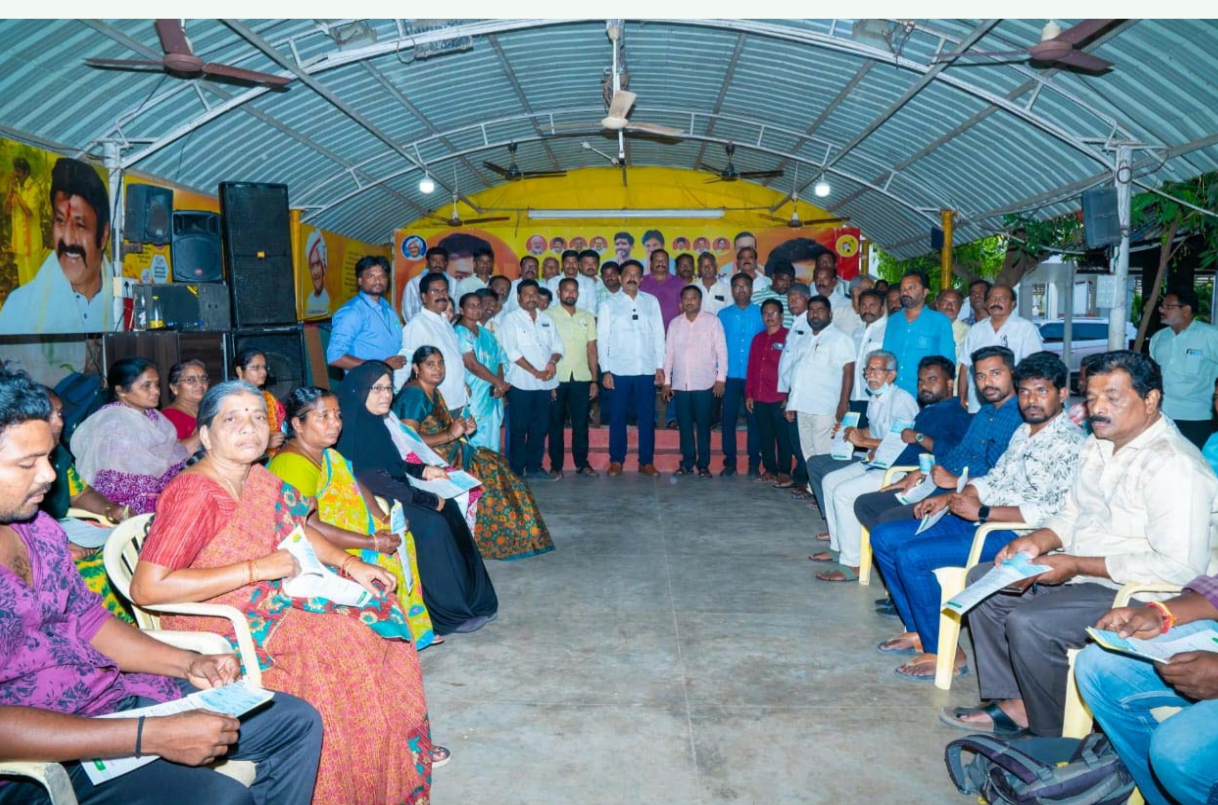
ఠాడిగడప,మార్చి31.అక్షర టైమ్స్:- పెనమలూరు నియోజకవర్గం, ఠాడిగడప మున్సిపాలిటీ, పోలవరం తెలుగుదేశం పార్టీ కార్యాలయంలో నియోజకవర్గంలో వివిధ గ్రామాలకు చెందిన 33