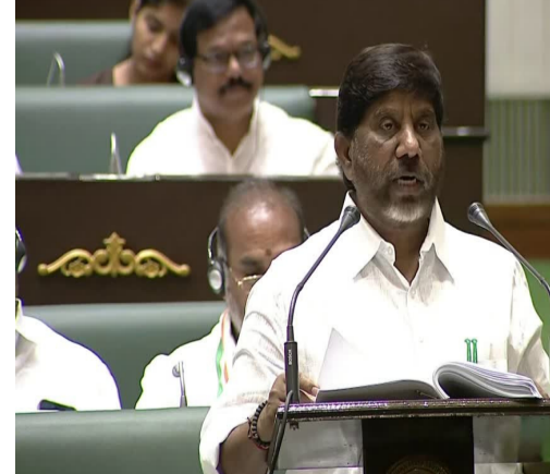
అధికారంలోకి వచ్చిన వెంటనే అటువల పరచిన మొదటి వ్యాసం ఉచిత బస్సు ప్రయాణాన్ని భద్రీ విక్రమార్కు పేర్కొన్నారు. ఈ పథకం ద్వారా ప్రతిరోజు రాష్ట్రంలోని 34 లక్షల 37 వేల మంది ఆడబిడ్డలు ఉచితంగా ఆర్టీసీ బస్సుల్లో ప్రయాణిస్తున్నారని చెప్పారు. ఇప్పటివరకు ఈ పథకం ద్వారా రాష్ట్రంలోని మహిళలు 269 కోట్ల 68 లక్షల ఉచిత ప్రయాణాలు చేసి, దాదాపు రూ.9,222 కోట్లు అదా చేసుకున్నారని వెల్లడించారు. ఈ సంవత్సరం మహిళాశ్రీ పథకానికి రూ.4,305 కోట్లు కేటాయిస్తున్నట్లు వెల్లడించారు.

యువతకు విదేశీ ఉపాధి అవకాశాలు కల్పించేందుకు : రాష్ట్ర యువతకు సురక్షితమైన విదేశీ ఉపాధి అవకాశాలు కల్పించేందుకు వీలుగా ఏర్పాటు చేసిందని ఆయన అన్నారు. తెలంగాణ ఓపర్టిన్ మ్యాన్ వరకే కంపెనీ లిమిటెడ్ టాప్ కామ్ ద్వారా యువత, జర్నలిస్ట్, జూనియర్, యూత్, కెనడా వంటి 16 దేశాల్లో సుమారు 13,930 మంది యువతకు ఉద్యోగ అవకాశాలు కల్పించిందని ఆయన అన్నారు. ఈ కార్యక్రమాన్ని మరింత సుమధురంగా నిర్వహించేందుకు వీలుగా నూతనంగా "ఓ.ఎం. ఓపర్టిన్ ఎంప్లాయిమెంట్ ట్రోగ్రాం" ను ప్రారంభిస్తున్నారన్నారు. ఈ బడ్జెట్లో కార్యక్రమ సంక్షేమ శాఖకు రూ.998 కోట్ల రూపాయలు ప్రతిపాదించారు తెలిపారు. చేయూతో నూతన పెన్షన్లు : చేయూత పథకానికి అర్హులైన వారికి 2 లక్షల నూతన పెన్షన్లను మంజూరు చేస్తున్నారన్నారు. నేటి బడ్జెట్లో చేయూత పథకానికి రూ.14,861 కోట్లు కేటాయిస్తున్నట్లు వెల్లడించారు. గృహశ్రోతి పథకానికి రూ.2,080 కోట్లు : గృహశ్రోతి పథకం