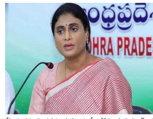
చేసింది పచ్చి మోసమని, ముష్టి 10 వేల పోస్టులకు పెద్దగా ఇచ్చి గొప్పలు చెప్పుకోవడం సిగ్గుచేటని మండిపడ్డారు. రెండేళ్లుగా నిరుద్యోగులను ఊరించి చివరకు ఉపసంహరించారని ఆగ్రహం వ్యక్తం చేశారు. ఈ సందర్భంగా వివిధ శాఖల్లోని ఖాళీలపై ఆమె

ప్రభుత్వాన్ని నిలదీశారు. "విద్యాశాఖలో 30 వేలు, పోలీస్ శాఖలో 19,999, ఇంజనీరింగ్ విభాగంలో 20 వేలు, వంచాయతీ రాజ్ లో 26 వేలు, మున్సిపల్ శాఖలో 27 వేలు, రెవెన్యూలో 13 వేలు, వైద్యశాఖలో 26 వేలు ఖాళీలను వెంటనే నింపుతామని ఇచ్చిన హామీలు ఏమయ్యాయి?" అని శర్మిల ప్రశ్నల వర్షం కురిపించారు. రాష్ట్రంలోని 153 విభాగాల్లో కలిపి 1.80 లక్షల ఉద్యోగాలు ఖాళీగా ఉన్నాయని, రెండేళ్లకు కలిపి కనీసం 50 వేల ఉద్యోగాలుగా భద్రీ చేస్తామని ఉందని ఆమె అన్నారు. 50 లక్షల మంది నిరుద్యోగులన్నీ రాష్ట్రంలో ఇలాంటి క్యాలెండర్లు కాకుండా భారీ స్థాయిలో ఖాళీలను భద్రీ చేయాలని కాంగ్రెస్ పార్టీ పక్షాన డిమాండ్ చేశారు. అలాగే, ప్రతివ్యక్తులకు ఉండగా ఇచ్చిన హామీ మేరకు ఉద్యోగాల దరఖాస్తుకు వయోపరిమితిని 42 నుంచి 46 ఏళ్లకు పెంచాలని ఆమె ప్రభుత్వాన్ని కోరారు. కోవెడ్ పాటికల్ లక్షలు ఖర్చు చేసి ఎదురుచూస్తున్న యువతకు న్యాయం చేయాలని పూర్తి డిమాండ్ చేశారు.