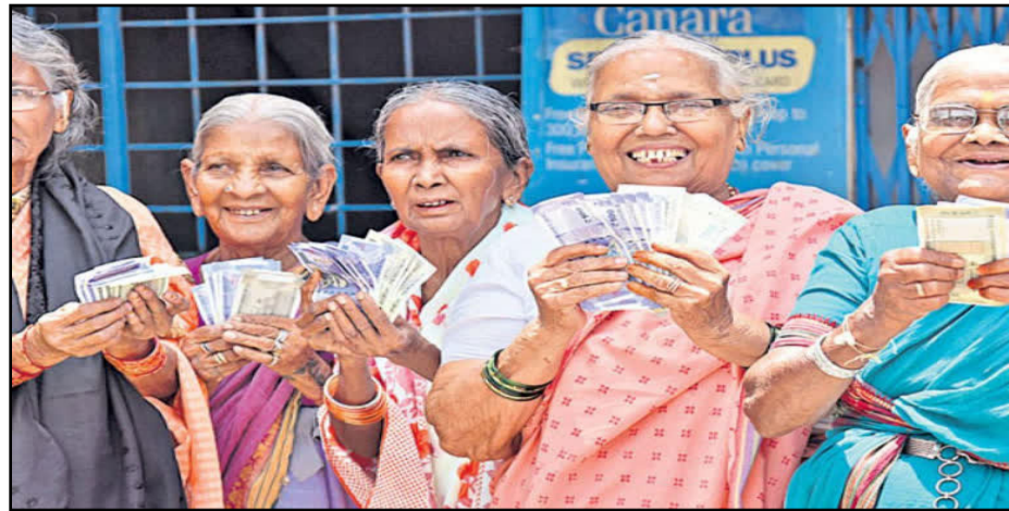
కొత్తగా 2 లక్షల చేయూత పంచును.. బడ్జెట్లో తెలంగాణ సర్కార్ కీలక ప్రకటన