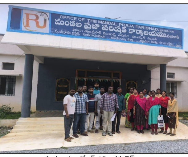
నందలూరు, అక్టోబర్ 15, అక్షర టైమ్స్:-

ఆంధ్రప్రదేశ్ గ్రామ వార్డు వాలంటీర్స్ అసోసియేషన్ వాలంటీర్లు ప్రభుత్వానికి ప్రజలకు మధ్య వారధి లాగా పని చేస్తూ ప్రభుత్వ పథకాలను ప్రజలకు అందిస్తున్న వాలంటీర్లను ఎప్పటి కుంటుం వచ్చినట్లు వాలంటీర్లకు ఉద్యోగ భద్రత కలిగిస్తామని, వాలంటీర్లకు 10000వేల రూపాయలు గౌరవ వేతనం ఇస్తామని ప్రభుత్వం ఇచ్చిన హామీలను వెంటనే ఉపయోగ చేయాలని నాలుగు నెలల వచ్చిన పాలనలో వాలంటీర్లకు జీతాలు ఉద్యోగ భద్రత గాని కల్పించలేదని ఆవేదన వ్యక్తం చేస్తూ ఇప్పటికైనా వాలంటీర్లకు పెండింగ్ లో ఉన్న జీతాలు, ఉద్యోగ భద్రత కల్పిస్తూ 10000 రూపాయలు, గౌరవ