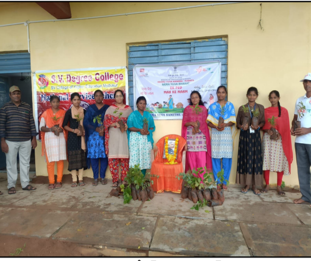
మైదుకూరు, అక్టోబర్ 15, అక్షర టైమ్స్:-