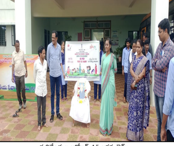
పులివేందుల, అక్టోబర్ 15, అక్షర టైమ్స్:-